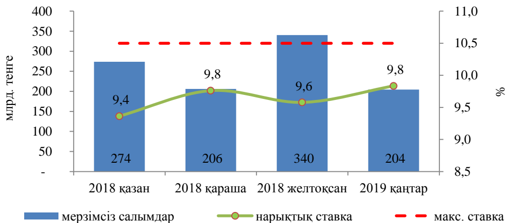
2-диаграмма. Салымдар бойынша сыйақы мөлшерлемелері және мерзімсіз салымдардың көлемі

Орташа өлшенген нарықтық ставка 9,4-9,8% интервалында шекті мөлшерлеме 10,5%.